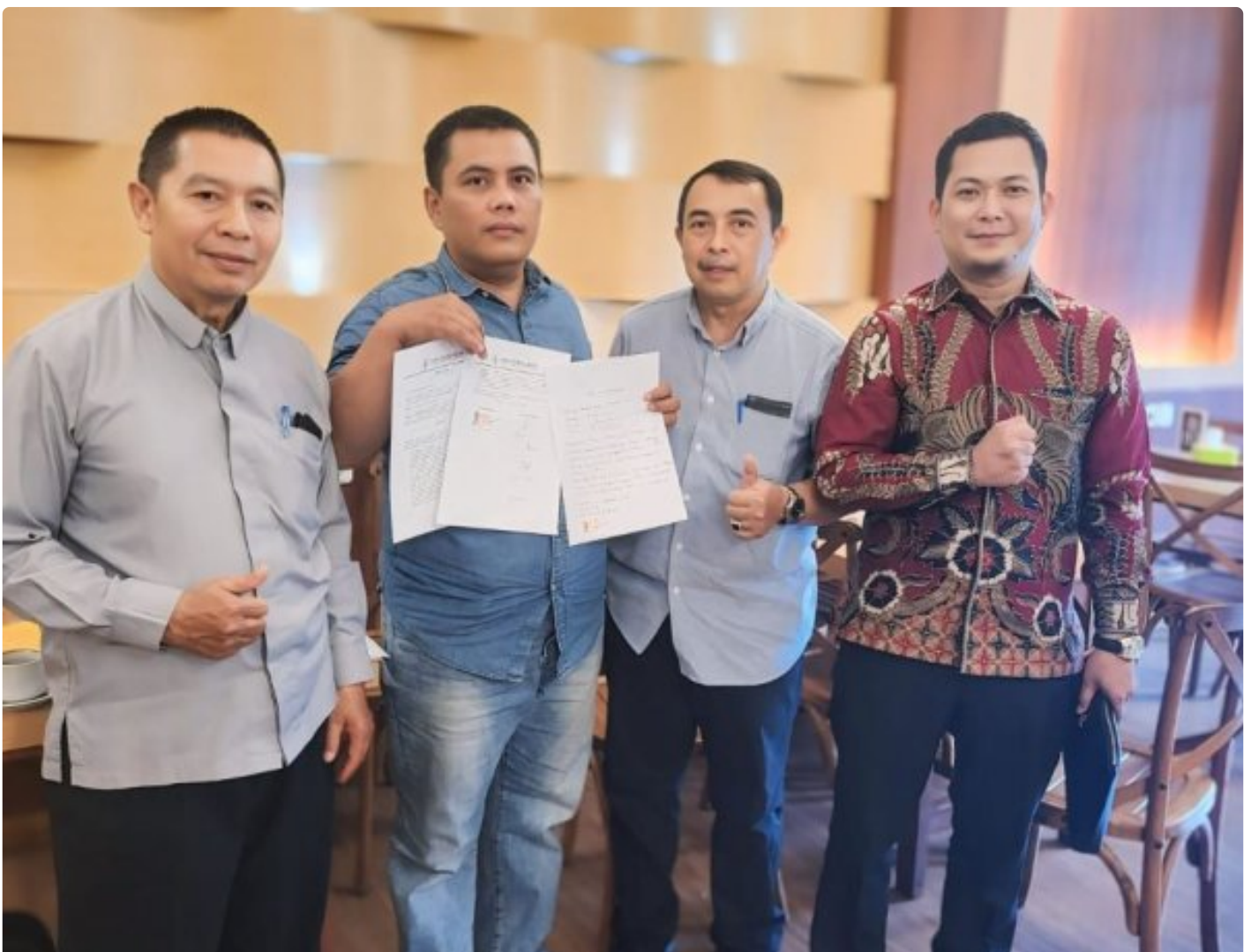
Kuasa Hukum Ningto Wahyu Dens & Partners Lawfirm di perkara Dugaan Pemalsuan Data dan Kredit Fiktif di Bank BRI Unit Kalideres.

JAKARTA, JNI - Seorang bekas nasabah Bank BRI, yang dikenal dengan inisial NW, melaporkan dugaan pemalsuan data dan kredit fiktif yang melibatkan oknum